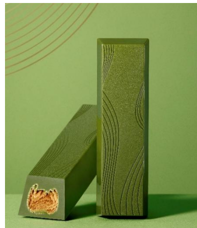
クラフト ルマンド ル・ショコラ Op.003 抹茶