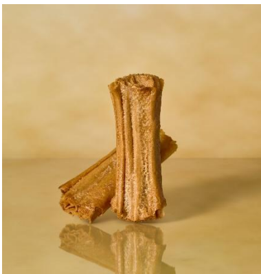
クラフト ルマンド クリスプ Op. 001 シュガーバター

50 年以上展開しているクレープクッキー“ルマンド”。その繊細な素焼きのクレープ生地の味わいをお届けしたいという思いから誕生した「U n BOURBON」のフラッグシップルマンドです。発酵バターをたっぷりと練り込んで焼きあげたクレープ生地を幾重にも丁寧に折り重ね、その上にペーストを塗り軽く焼きあげました。香ばしい素焼きのクレープ生地が持つ独創的なクリスピー食感を活かした、風味豊かな味わいをお楽しみいただけます。