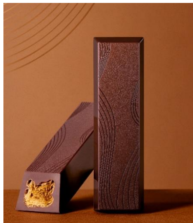
クラフト ルマンド ル・ショコラ Op.001 カカオ

「クラフト ルマンド ル・ショコラ」シリーズは幾重にも重ねたクレープ生地をカカオやベリー、抹茶の味わいが際立つ、濃厚で独創的なチョコレートで包んだ商品です。チョコレートの天面にはルマンドのクレープ生地をモチーフとした美しい模様を施しており、「Un BOURBON」でしか出会うことができない特別なルマンドです。