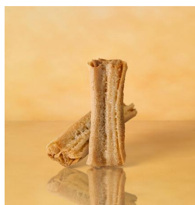
クラフト ルマンド クリスプ Op. 005 メープル