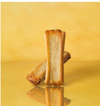
クラフト ルマンド クリスプ Op. 004 チーズ