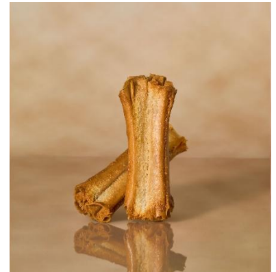
クラフト ルマンド クリスプ Op. 003 セサミ