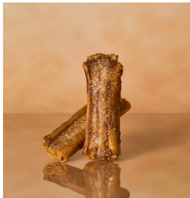
クラフト ルマンド クリスプ Op. 002 シナモン